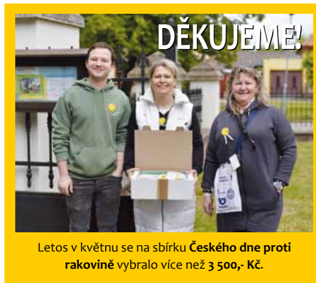
Letos v květnu se na sbírku Českého dne proti rakovině vybralo více než 3 500,- Kč.

za 250.000,- Kč pro obec. Ale tato výhrada platí pouze za podmínky, že manželé Urválkovi tento objekt sami chtějí prodat. P. Urválek je v exekuci, ze své vůle nemovitost prodat nechce. Obec Trnávka může právo zpětné koupě realizovat v dražbě, ale za tzv. obvyklou, resp. tržní cenu, která dle odhadu insolvenčního správce činí 1.100.000,- Kč. Za dobu vlastnictví totiž p. Urválek nemovitost zateplil a zhodnotil a dle odhadu insolvenčního správce podle stavu majetku, lokace objektu a zájmu, byla tržní cena stanovena na 1.100.000,- Kč.